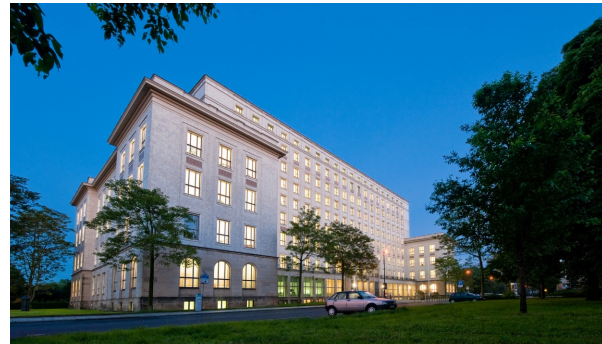
Zentralgebäude der HTW Dresden