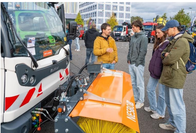
Kommunaltechnik am Beispiel eines Multicar