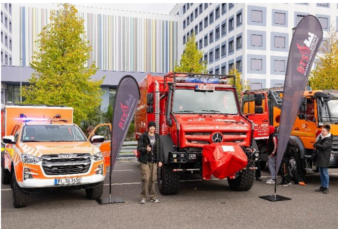
Feuerwehrfahrzeuge der Firma Brandschutztechnik Stolpen