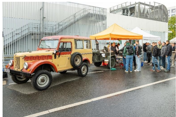
Essenausgabe an der Gulaschkanone der Fleischerei Richter