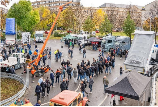
Praxisnachmittag auf dem Ausstellungsgelände