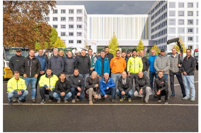
Aussteller und Organisatoren des 15. Dresdner Nutzfahrzeugtages