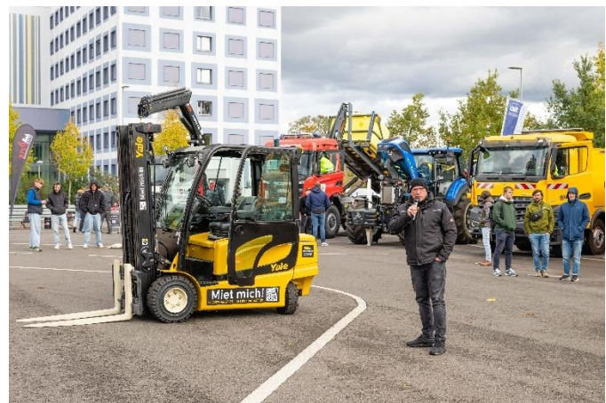
Gabelstaplerpräsentation der Firma Yale