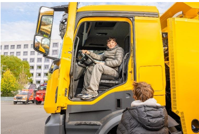
„Probesitzen“ in einem Bergefahrzeug der DVB