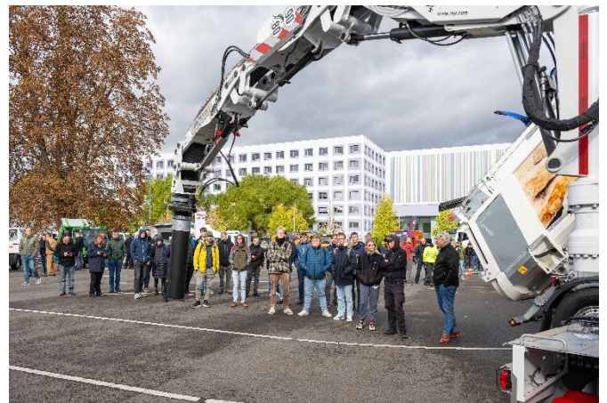
Vorführung eines Saugbaggers der Firma RSP GmbH