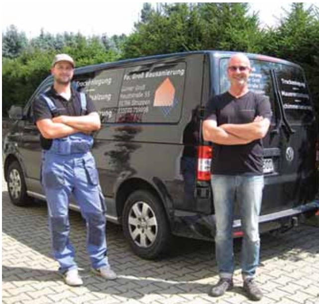
Die Firma Groß – seit mehr als 25 Jahren Ihr zuverlässiger Partner.