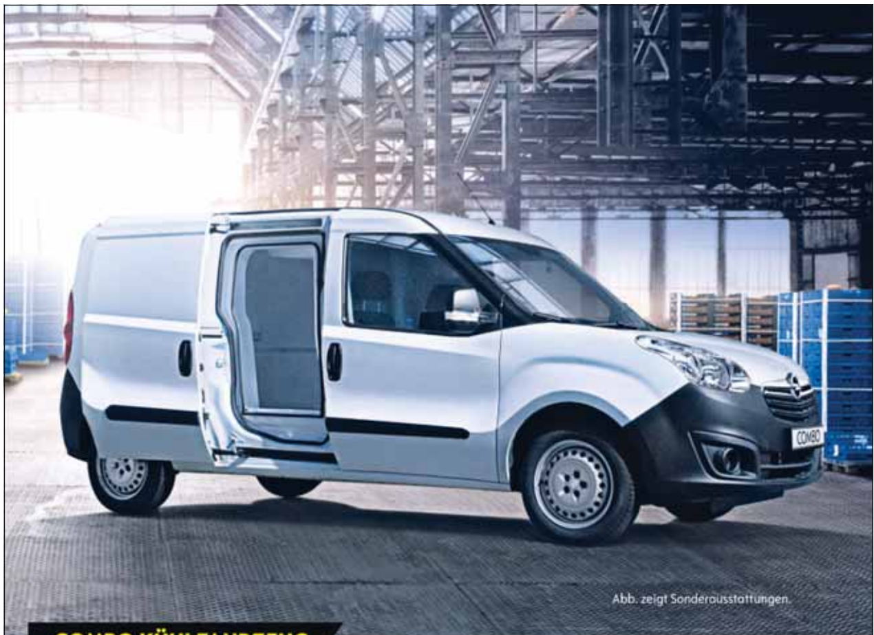
Abb. zeigt Sonderausstattungen.